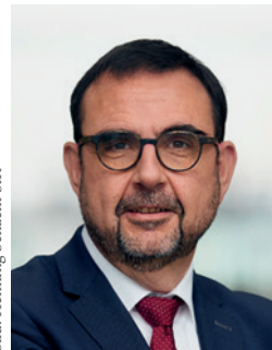
Staatsminister Klaus Holetschek

„Sterbewünsche sind häufig am Lebensende, auch der Wunsch nach Suizidassistenz gehört dazu. Menschen drücken damit aus, dass sie so nicht mehr leben wollen. Hospiz- und Palliativversorgung bieten vielfältige Unterstützung und der Zugang zu dieser Versorgungsform sollte leichter möglich sein als der Zugang zu Suizidassistenz.“